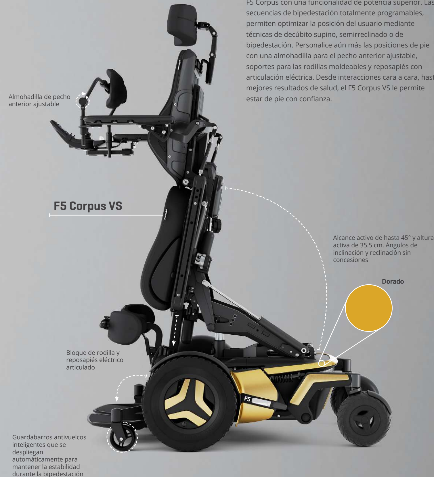
F5 Corpus VS

Combinamos todas las características de rendimiento del F5 Corpus con una funcionalidad de potencia superior. Las secuencias de bipedestación totalmente programables, permiten optimizar la posición del usuario mediante técnicas de decúbito supino, semirreclinado o de bipedestación. Personalice aún más las posiciones de pie con una almohadilla para el pecho anterior ajustable, soportes para las rodillas moldeables y reposapiés con articulación eléctrica. Desde interacciones cara a cara, hasta mejores resultados de salud, el F5 Corpus VS le permite estar de pie con confianza.