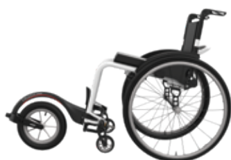
ICON 60 con FreeWheel

Freno tijera horizontal, con opción de freno vertical deportivo