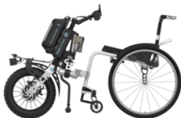
ICON 60 con dispositivo motorizado